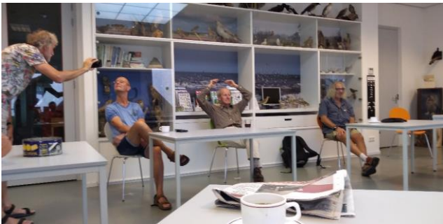
Eindelijk weer inloopochtend!

Inloopochtenden: in juli kon eindelijk de eerste inloopochtend van het jaar doorgaan. In totaal zijn er 5 inloopochtenden geweest. December moest weer afgelast worden.