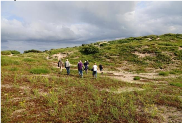
Excursie Coepelduynen – foto: Dini Thibaudier

De eerste excursie in 2021 was op 6 juli in de Coepelduynen, waar het maximum aantal deelnemers gezien de COVID maatregelen, nl 12, aan heeft deelgenomen.