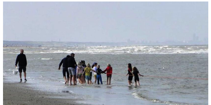
Op zoek naar zeediertjes

In de eerste twee kwartalen konden de jeugdexcursies geen doorgang vinden. De op zaterdag 4 september georganiseerde jeugdactiviteit "Op zoek naar zeediertjes" kon gelukkig wel doorgaan. Er hebben 17 deelnemers goede vangsten gedaan met als hoogtepunt een Pieterman. Bij de paddenstoelenexcursie op 9 oktober was het goed zoeken naar paddenstoelen. Door het droge weer was er niet veel te vinden. Maar de 9 deelnemertjes wisten toch mooie exemplaren te vinden, waaronder een grote Biefstukzwam!