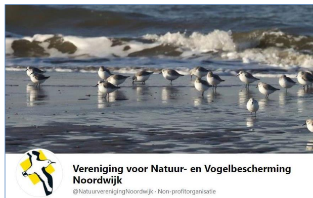
Facebook startpagina VNVN

De website en facebook zijn ook in 2021 digitaal druk bezocht en leverde met name op facebook veel reacties op.