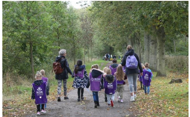
Herfstnatuurspel 2021

De inmiddels 44 e editie van het Herfstnatuurspel op 20 oktober was ook dit jaar weer een groot succes. Ondanks de slechte weersvoorspellingen namen er maar liefst 170 kinderen aan deel en het weer was uiteindelijk prima. In totaal zijn er 365 kinderen bij activiteiten van de jeugdnatuurclub betrokken geweest. Een mooi resultaat! Ondanks de (steeds wisselende) COVID maatregelen konden er verschillende excursies toch doorgang vinden. De uitgebreide verslagen kunt u lezen op de website.